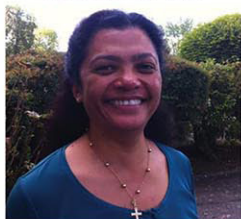
Rondro, 48 ans Le Luat-sur-Vert

"J'aimerais que les trous de la place des oiseaux soient rebouchés et qu'on y plante des fleurs"