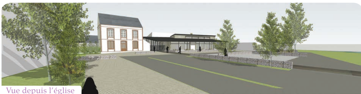
Vue depuis l'église

Il est évident que la circulation et le stationnement seront difficiles à proximité de l'école élémentaire. Chacun devra être vigilant, respecter le balisage mis en place et faire preuve de compréhension.