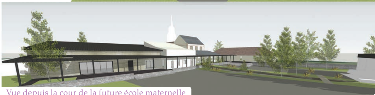
Vue depuis la cour de la future école maternelle