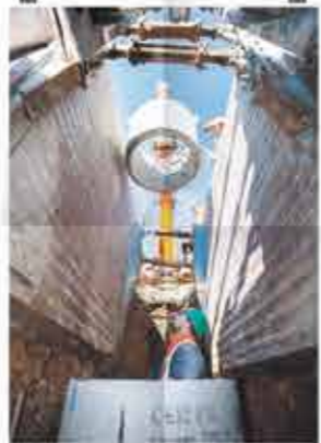
Les travaux à Ste Ève en 2016

Cela s'est traduit par des visites du Centre de Tri Natriel et des animations à l'Ecol'logis. Des interventions en classe et animations lors de divers événements (Vernouillet plage, campus d'été, Naturalies, Troc Nature, la Semaine du développement durable) ont également rythmé l'année.