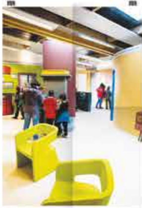
L'Eco Logis accueille chaque année de nombreux groupes d'enfants.