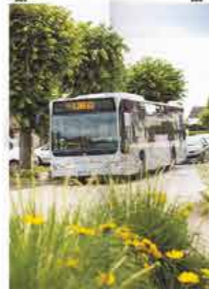
De nouveaux bus plus modernes et fonctionnels