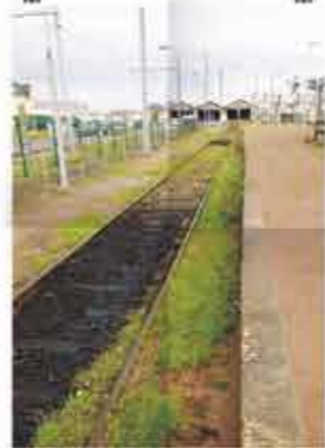
La friche de la gare de Dreux