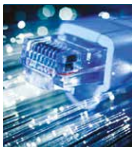
Le projet phare de 2019 : l'arrivée de la fibre optique