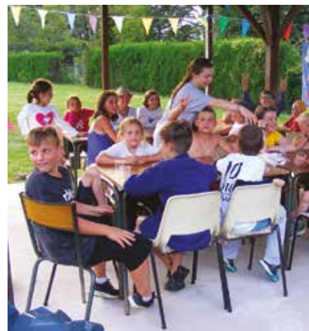
Le centre de loisirs rencontre un vif succès auprès de nos enfants