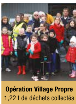
Opération Village Propre 1,22 t de déchets collectés

Comme vous pouvez le constater, il se passe toujours quelque chose à Vert-en-Drouais, surtout si l'on rajoute toutes les animations proposées par les associations de notre commune !